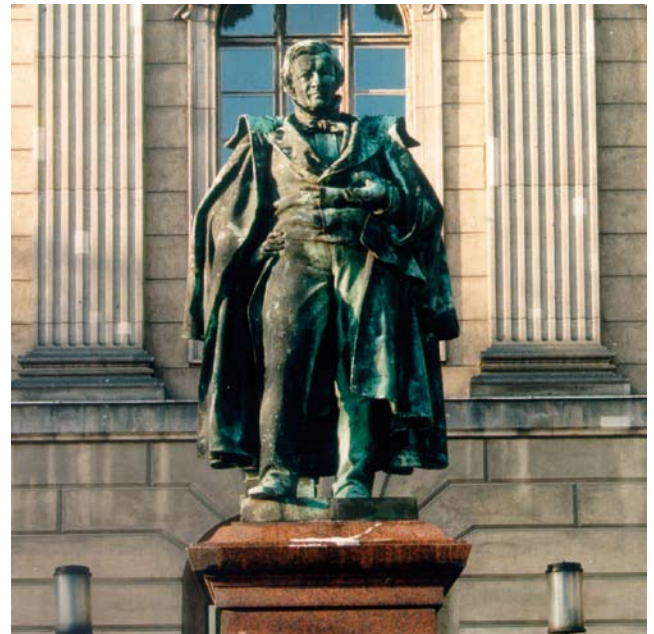
Eilhard Mitscherlich (1794–1863) , Chemiker und Mineraloge, seit 1822 Professor für Chemie an der Berliner Universität, 1854 zum Rektor gewählt, wurde durch die von ihm entwickelten analytischen Bestimmungsmethoden für Atomgewichte chemischer Elemente berühmt. Als Erster stellte er künstlich eine größere Anzahl von Mineralien her und initiierte 1858 die Einführung der Gasbeleuchtung im Universitätsgebäude.

Bereits im Mai 1868, als noch an keines der zukünftigen Denkmäler der Alma Mater zu denken war, erreichte die Universität ein Gesuch zur Aufstellung eines Mitscherlich-Denkmal, das jedoch durch den Akademischen Senat abschlägig beschieden wurde. Im Herbst 1891, nachdem die Humboldt-Denkmal aufgestellt und 1882 das beeindruckende Ehrenmal für Albrecht von Graefe von Rudolf Siemering vor der Charité enthüllt war, fand nunmehr erneut eine Sammlung für ein Mitscherlich-Denkmal statt. 30.000 Mark wurden gespendet